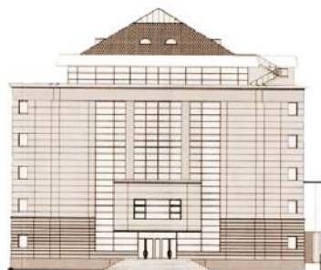
Sediul modern al Bibliotecii ASTRA inaugurat la 1 ianuarie 2007

Mi-am imaginat întotdeauna Paradisul ca o Bibliotecă.