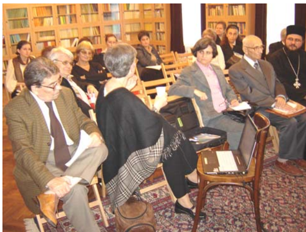
ICSU Sibiu – Sesiunea jubiliară (2006)

Din anul universitar 1999-2000 am trecut cu norma de bază la “Facultatea de litere” din Sibiu pe postul de profesor de folclor și etnologie, iar la “Institutul de Cercetări Socio-Umane” am rămas cu ½ normă și redactor șef al anuarului Studii și Comunicări de Etnologie din care au apărut până acum 20 tomuri.