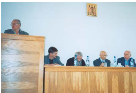
Colocviile de etnografie și folclor de la Alba-Iulia (2007)

reușit „să cresc” – în spiritul respectului pentru cultura și civilizația tradițională, o întregă pleiadă de tineri care, mai târziu, au abordat cu succes – ca cercetători și muzeografi – o serie de segmente ale culturii și civilizației rurale. Foști studenți de-ai mei la Universitatea din Alba-Iulia ocupă, actualmente, posturi de cercetători („Centrul de antropologie” și „Institutul de Cercetări Sud-Est Europene” – București) ori muzeografi ( Muzeul Unirii, Muzeul Sebeș, Muzeul „Astra” Sibiu), locuri de muncă bine cotate, cu reală vizibilitate științifică și culturală. Unii sunt deja doctori în etnologie, cu împliniri științifice deosebite, alții ocupă funcții importante în coordonarea unor foruri de cultură județene sau naționale. Pe majoritatea i-am sprijinit să debuteze în reviste ale Academiei Române și – când a fost cazul – să se înscrie la studii doctorale. Am avut câteva generații de studenți excepționali, dar și condiții speciale create de rectorul Iuliu Paul – una dintre cele mai importante personalități culturale și științifice ale județului Alba din perioada postdecembristă.