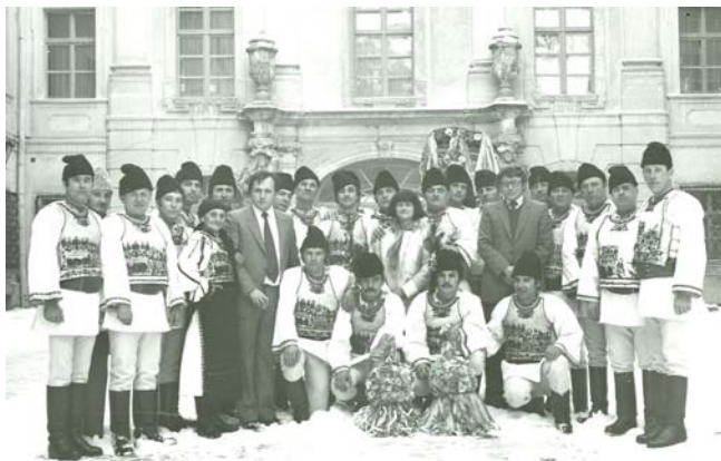
Cu ceata de colindători din Racovița (1983)

specializate, valori patrimoniale aduse la cunoștința muzeografilor sibieni.