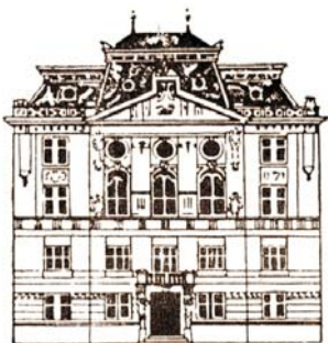
Palatul Asociației ASTRA, inaugurat în anul 1905, sediu al Bibliotecii ASTRA din 1904