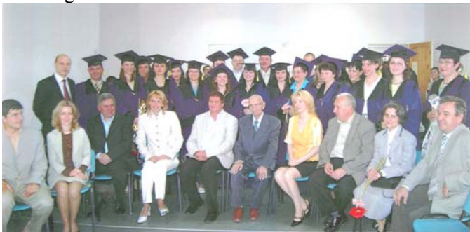
Curs festiv: absolvenții secției de sociologie-etnologie (2006)

I. M.: După 1989 am fost ales responsabil al sectorului de etnologie din cadrul institutului și am predat – în paralel – disciplinele folclor și etnologie la Universitatea “Lucian Blaga” din Sibiu.