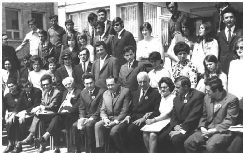
Colocviile de la Baia Mare (1971)