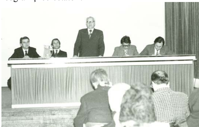
Mediaș - Simpozion: obiceiuri de iarnă

I. M.: Cântarea României , din punct de vedere etnologic, a avut cred un rol benefic. Prin aducerea pe scenă a obiceiurilor specifice unei zone sau alta, au conștientizat lumea rurală de valoarea acestora, de importanța costumelor populare și le-au prelungit puțin viața. Personal nu-mi amintesc de intervenții grosolane în textele folclorice, de deturnări de sensuri ș.a.m.d. Toate textele publicate în această perioadă sunt valabile și astăzi, iar simpoziunile prilejuite de organizarea festivalurilor zonale se transformau în adevărate cursuri de perfecționare pentru instructori, muzeografi și cercetători.