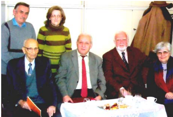
Aniversare la Muzeul Astra (13.02.2008)