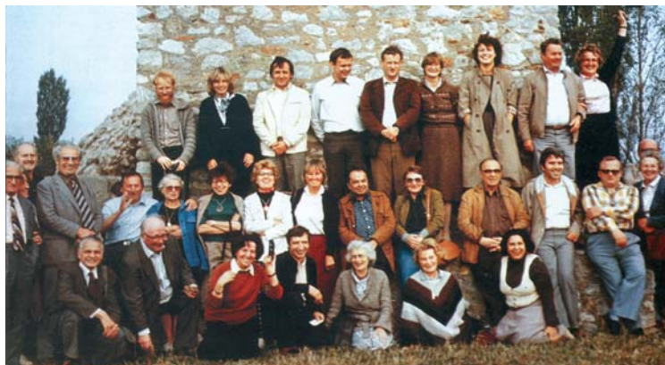
1981 - Simpozionul internațional de ceramică, Kitsee