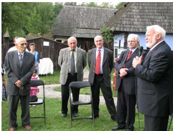
La Muzeul Astra - cu președintele Academiei Române