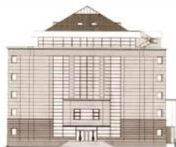
Sediul modern al Bibliotecii ASTRA inaugurat la 1 ianuarie 2007

Mi-am imaginat întotdeauna Paradisul ca o Bibliotecă . Jorge Luis