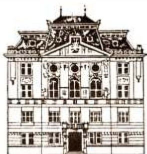
Palatul Asociației ASTRA , inaugurat în anul 1905, sediu al Bibliotecii ASTRA din 1904