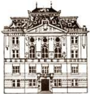
Palatul Asociației ASTRA , inaugurat în anul 1905, sediu al Bibliotecii ASTRA din 1904