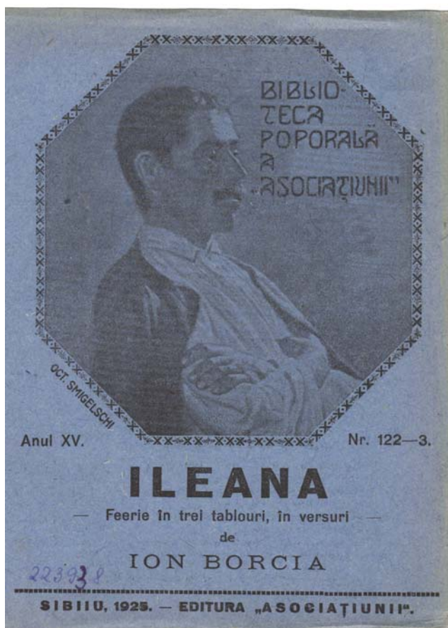
Ileana. Feerie în trei tablouri, în versuri de Ion Borgia. Sibiu: Editura Asociațiunii, 1925. (Biblioteca populară a Asociațiunii, 15, nr.122-123).