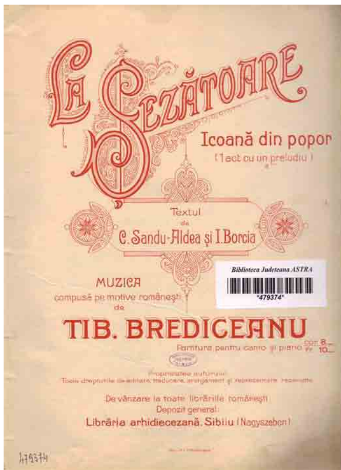
La șezătoare: icoană din popor (1 act cu un preludiu): [partitură] / Textul de C. Sandu-Aldea și I. Borcia; Muzica compusă pe motive românești de Tib. Brediceanu. Lipsca: Inst. lit. F.M.Geidel, f.a.