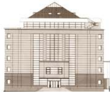
Sediul modern al Bibliotecii ASTRA inaugurat la 1 ianuarie 2007

Mi-am imaginat întotdeauna Paradisul ca o Bibliotecă . Jorge Luis Borges