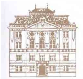
Palatul Asociației ASTRA , inaugurat în anul 1905, sediu al Bibliotecii ASTRA din 1904

1861 – 2007 146 ani în serviciul Lecturii