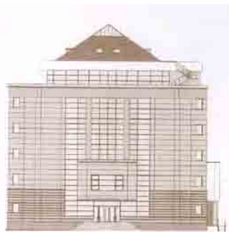
Sediul modern al Bibliotecii ASTRA inaugurat la 1 ianuarie 2007

Mi-am imaginat întotdeauna Paradisul ca o Bibliotecă.